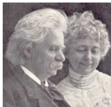
Nina og Edvard Grieg