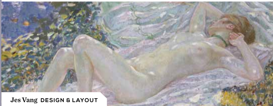
Jes Vang DESIGN & LAYOUT