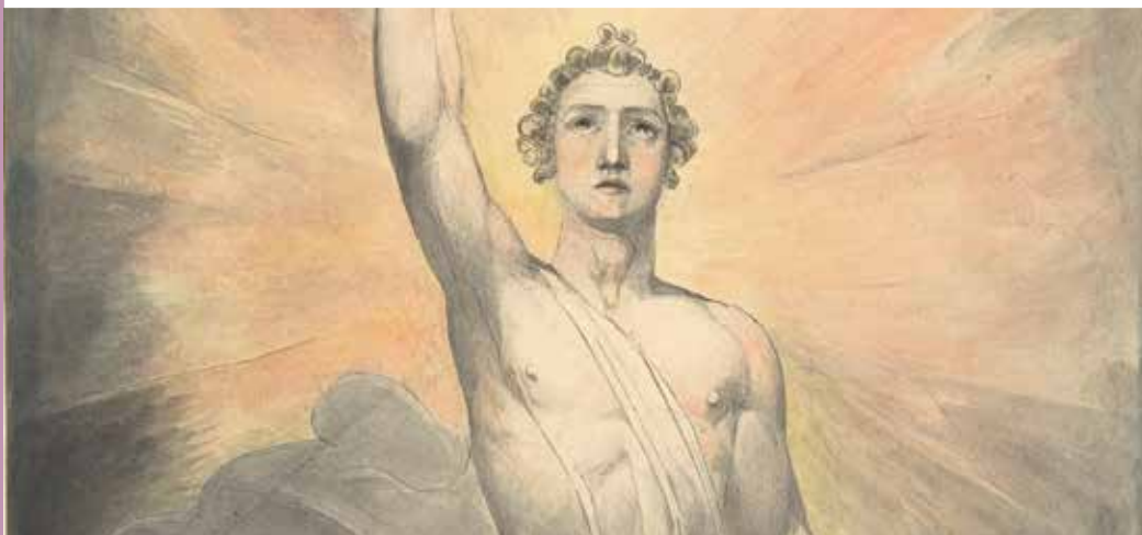
William Blake: Angel of the Revelation (Book of Revelation, chapter 10) (1803-5)