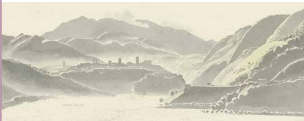
Josephus Augustus Knip: Gezicht op Cittaducale (ca. 1810-1812)