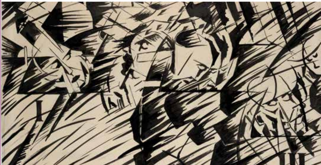
Umberto Boccioni: States of Mind: Those Who Go (1912)