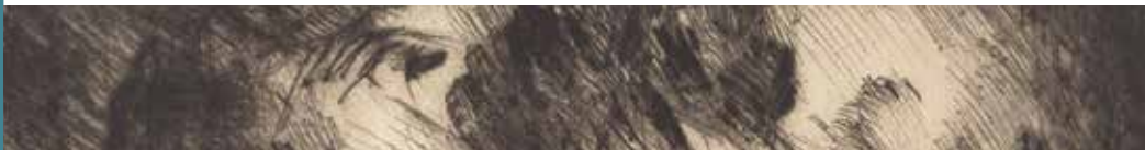
Lovis Corinth: Der Kuss (1921)