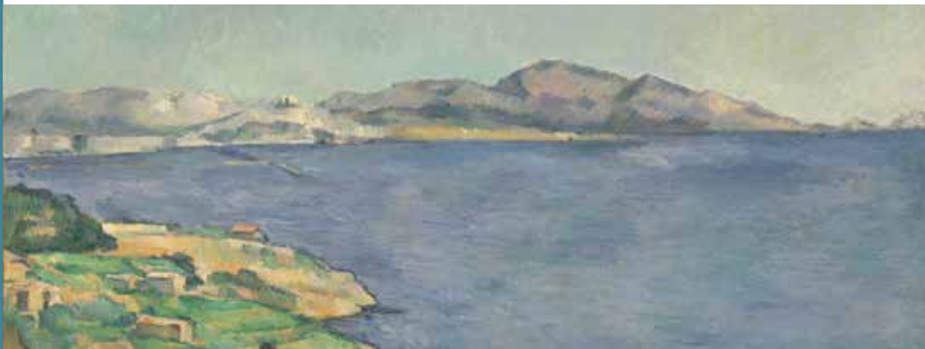
Paul Cézanne: Le Golfe de Marseille vu de l'Estaque (ca. 1885)