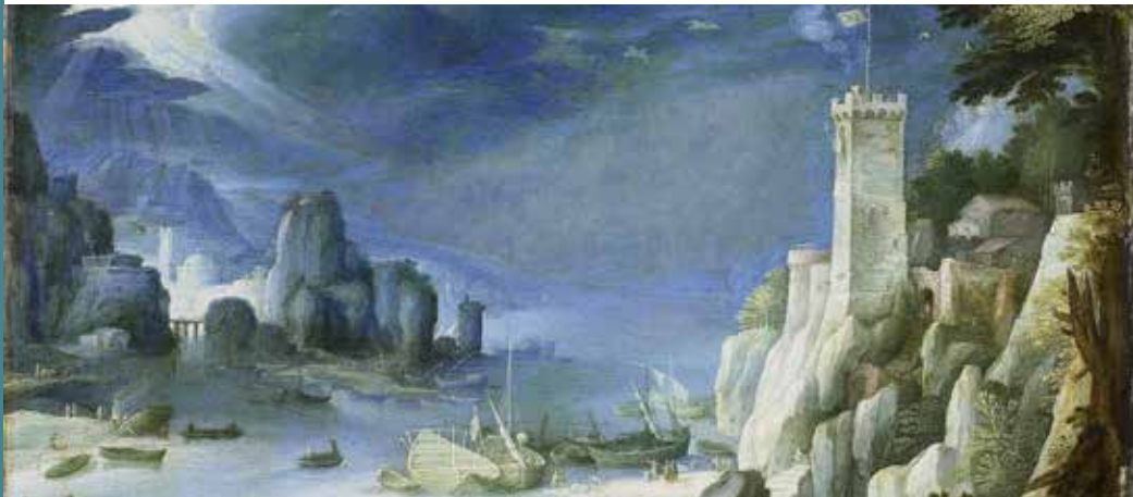
Paul Bril: Riviergezicht met rotsen (1601)