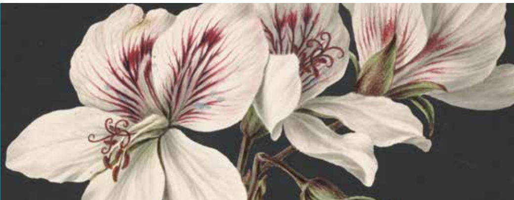
M. de Gijsselaar: Pelargonium album bicolor (1830)